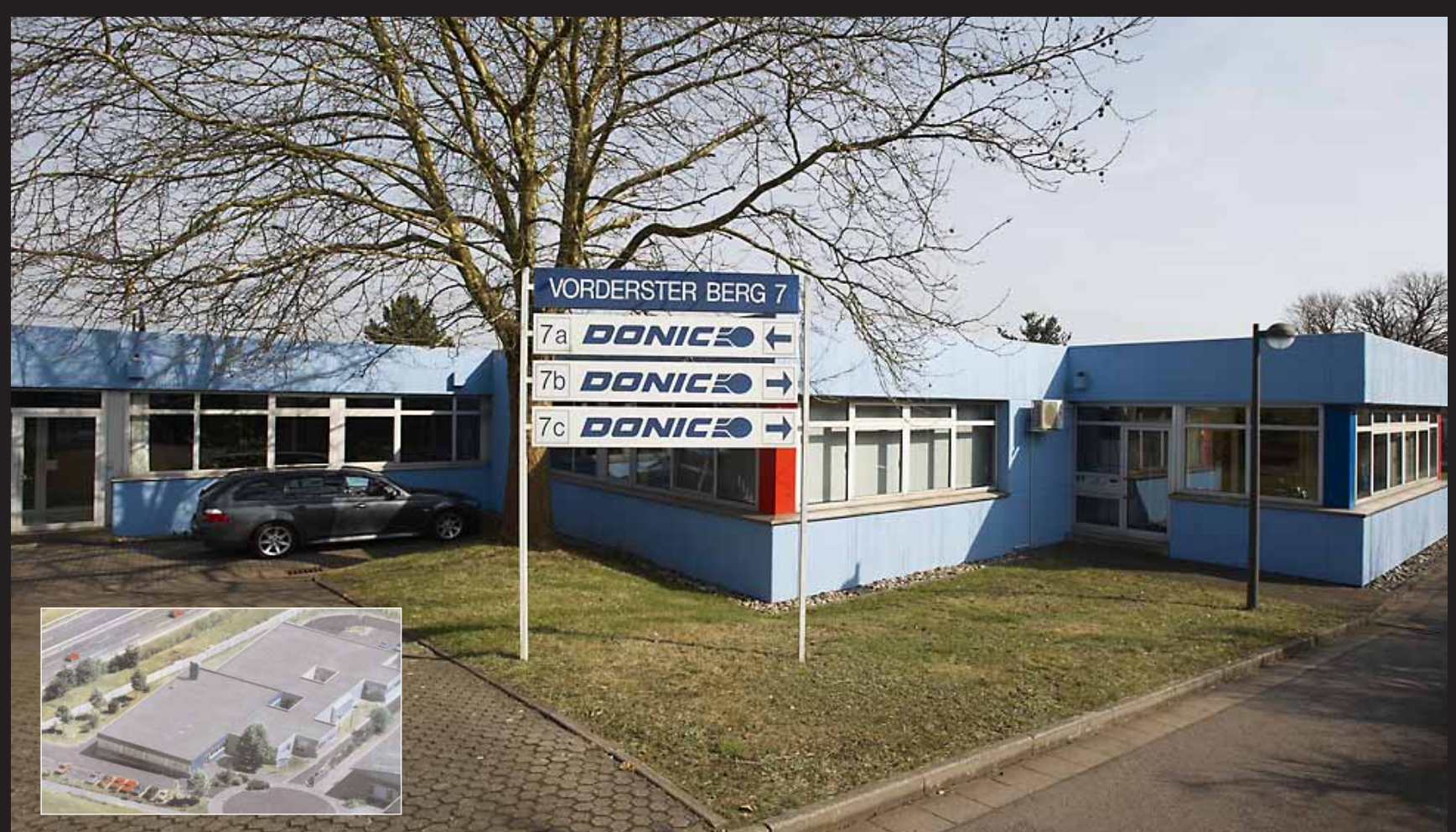
Le quartier générale de DONIC - Völklingen (Allemagne)