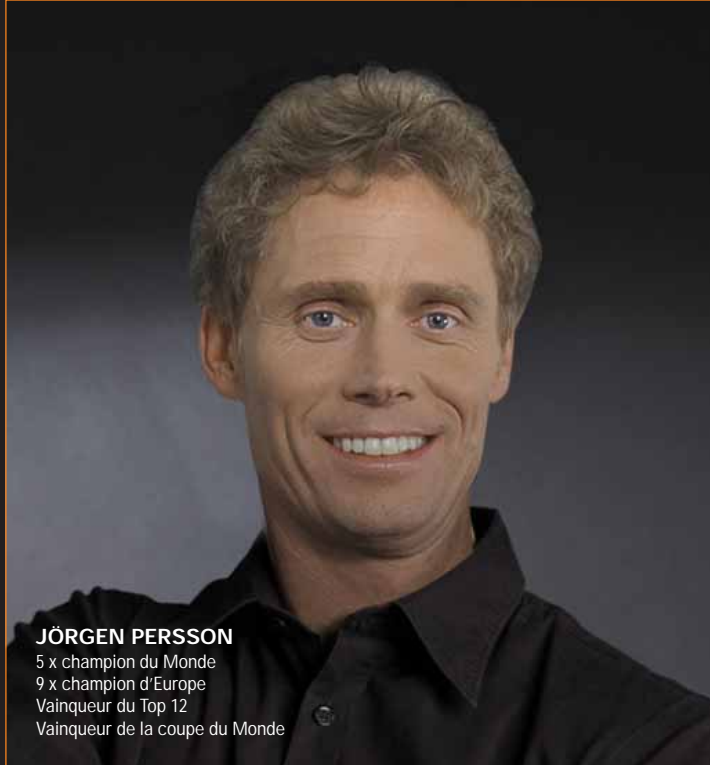
JÖRGEN PERSSON 5 x champion du Monde 9 x champion d'Europe Vainqueur du Top 12 Vainqueur de la coupe du Monde