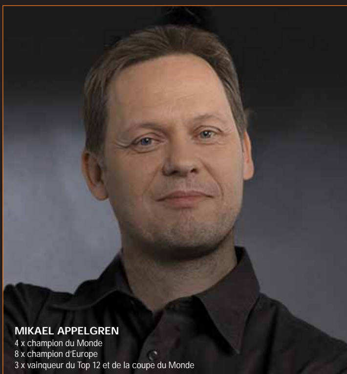
MIKAEL APPELGREN 4 x champion du Monde 8 x champion d'Europe 3 x vainqueur du Top 12 et de la coupe du Monde